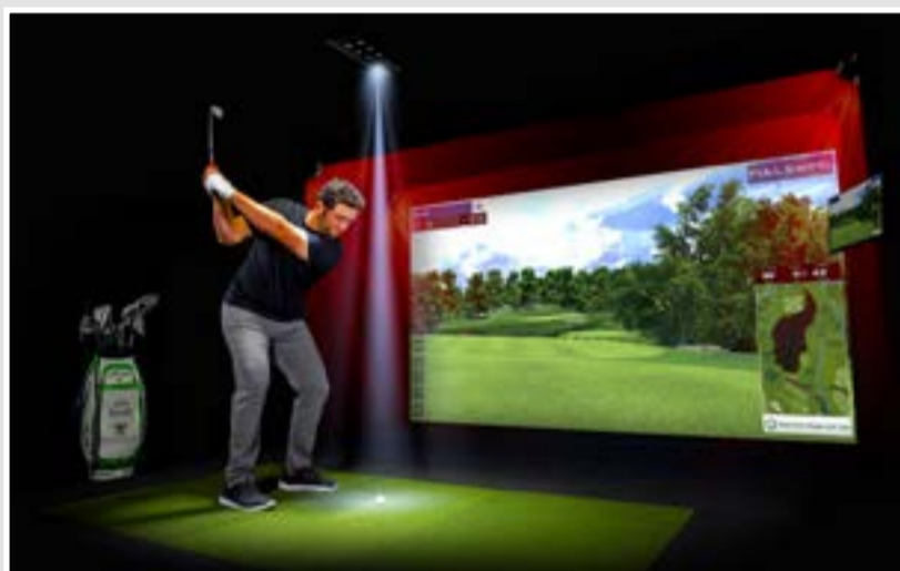
John Rahm trénuje na simulátoru FullSwing PRO2.0