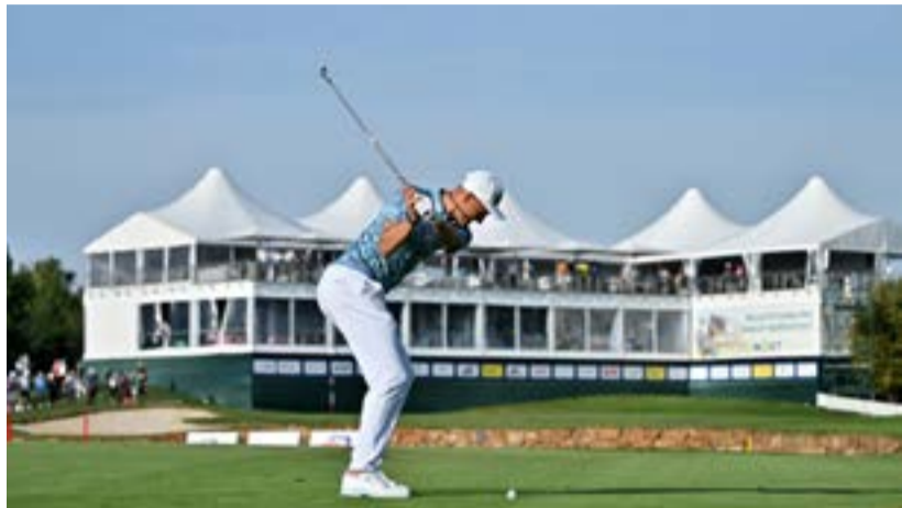
Tento obrázek už Albatross nevidí