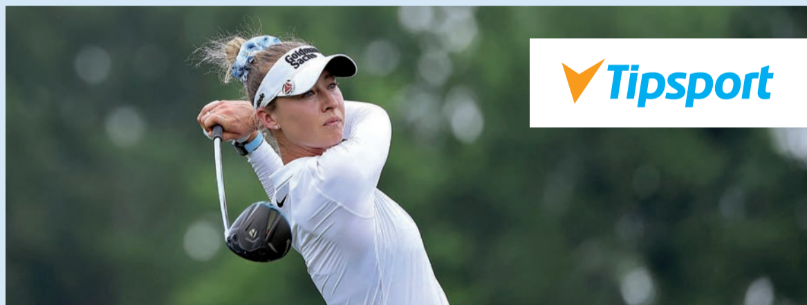
Nelly Kordová na Chevron Championship 2026