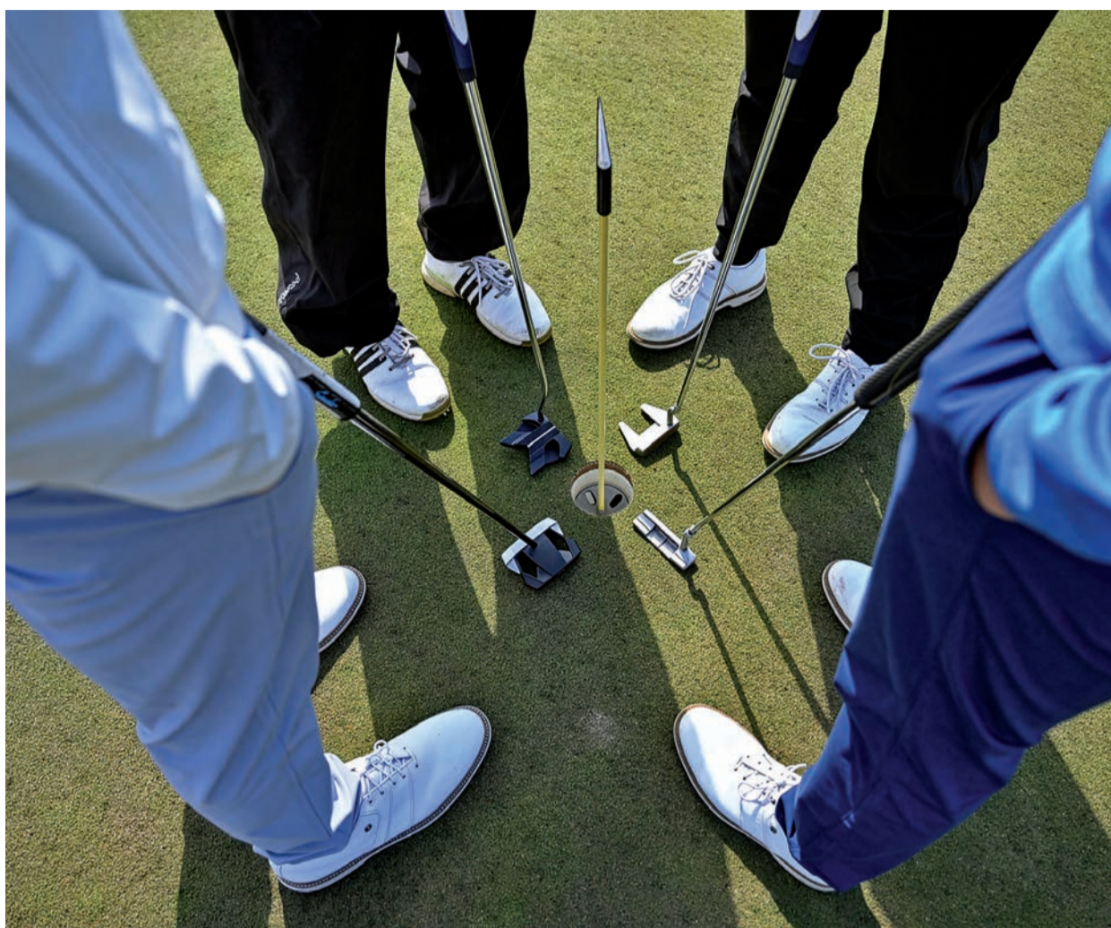
Víc hlav víc ví