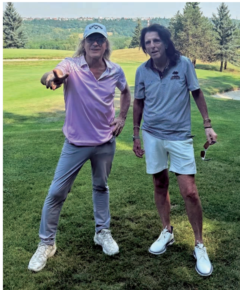
LEGENDA V MOTOLE Americký rocker a náruživý golfista Alice Cooper navštívil hřiště Golf Clubu Praha i se svým kytaristou

V článku o názvech jamek v předchozím čísle Golfových novin byla nedopatřením zařazena needitovaná verze boxu o osobnostech českého golfu. Za nepřesnosti se omlouváme a opravenou verzi najdete na webové stránce novin.